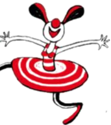
Atelier lors du week-end régional à Genève

Fin janvier, avait lieu la quatrième réunion annuelle de la Fédération ( www.ffach.fr ), à Grenoble. De nombreuses associations françaises travaillant en milieu hospitalier et institutions spécialisées ont été conviées. Trois membres de l'équipe d'Hôpiclowns étaient aussi présents. Durant un week-end nous avons pu réfléchir sur notre métier. Les ateliers portaient sur : « la relation entre le clown et la personne rencontrée dans l'établissement de santé ».