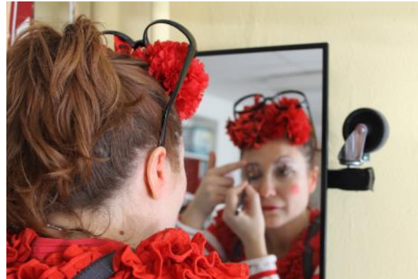
Aina se métamorphose en Trompeta

L'occasion de découvrir les pratiques de notre métier par delà les frontières, puisque nous avons rencontré les membres de onze autres organisations de clowns hospitaliers, venant de huit pays différents.