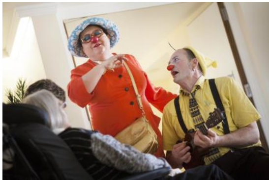
Berlingotte et Kai-Kai à Happy Days

A l'Établissement Médico-Social Happy Days à Plan-Les-Quates : les Hôpiclowns sont présents une fois par mois.