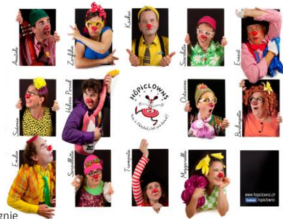
La nouvelle carte de la compagnie

A partir du dessin de Zep offert à l'association, nous avons fait des objets dérivés : des autocollants et des cartes postales que nous distribuons gracieusement, ainsi que des tasses et des T-shirts que nous vendons sur les stands pour financer les visites à l'Hôpital des Enfants.