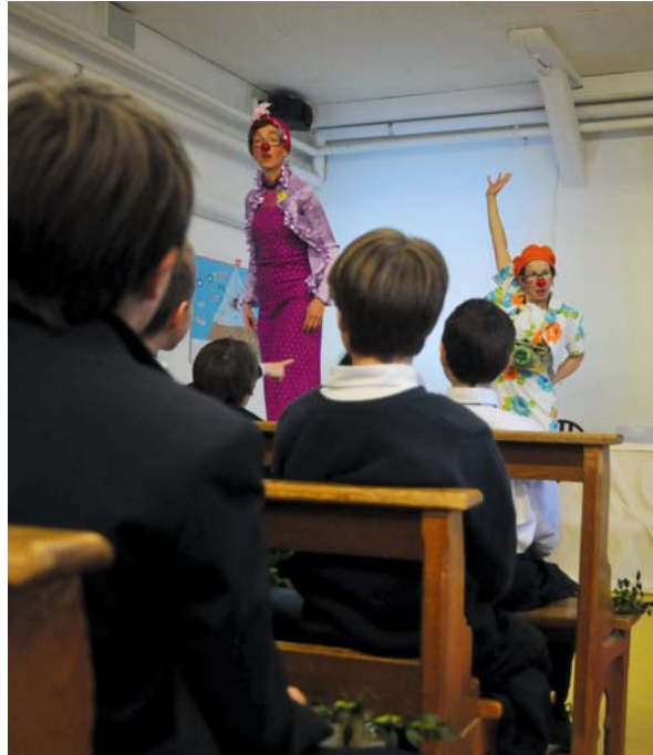
Les Hôpiclowns lors de la messe de Pâques à l'Institut International Notre-Dame du Lac

Totalement! Les équipes de clowns font un travail extraordinaire auprès des patients tout en respectant les rythmes du corps médical. Preuve de leur professionnalisme, de leur dévouement et de leur engagement!