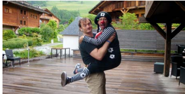
Certains clowns (Christian-Kaïkaï) ont saisi la clown au bond, comme l'atteste la photo, pour être du futur voyage.

Les Hôpiclowns ne tournent pas en rond, ils tournent en ronde avec le monde !